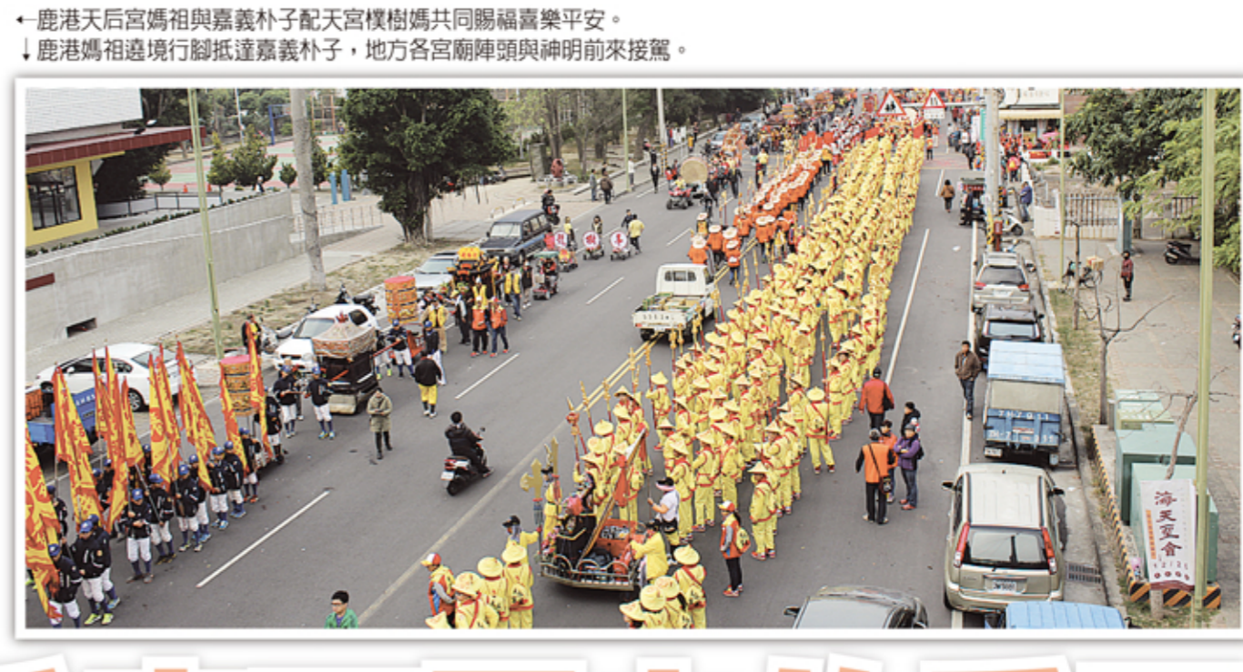
鹿港天后宮媽祖與嘉義朴子配天宮樓樹媽共同賜福嘉樂平安。 鹿港媽祖遶境行腳抵達嘉義朴子，地方各宮廟陣頭與神明前來接駕。