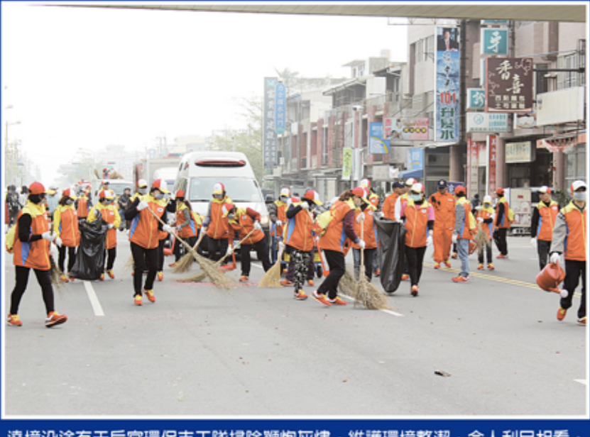
遶境沿途有天后宮環保志工隊掃除鞭炮灰燼，維護環境整潔，令人刮目相看。