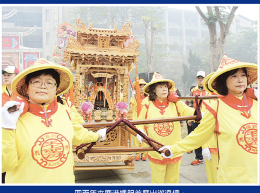
四百年來鹿港媽祖首度出巡遶境。