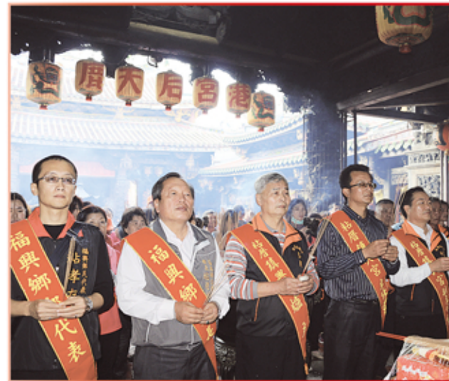
彰化縣福興鄉粘厝鎮興宮