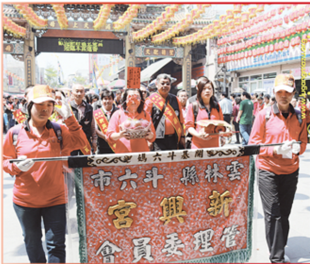
雲林縣斗六新興宮