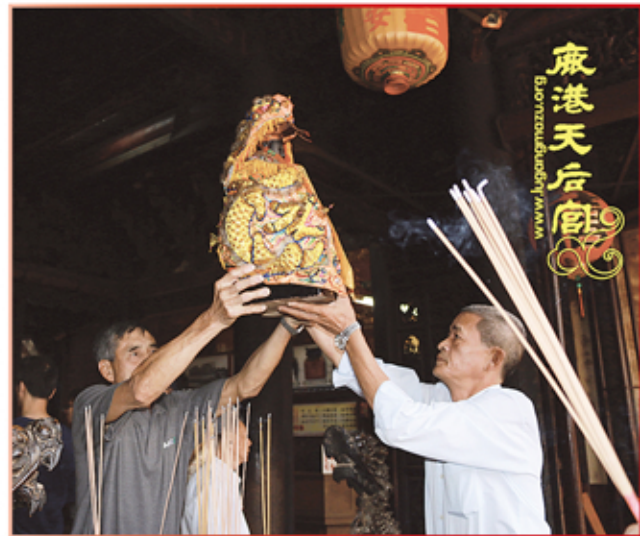
宜蘭縣金威廟進香團