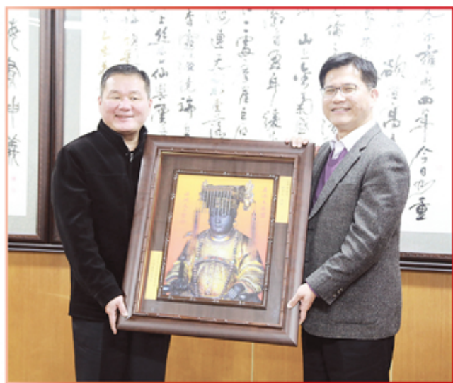
台中市林市長佳龍先生暨全體貴賓蒞臨