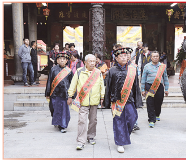
台南市代天府鎮南宮