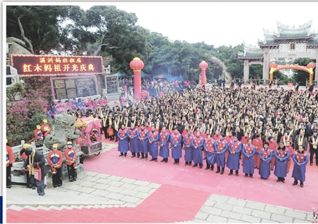
▲世界最大的紅木媽祖像安奉在福建莆田湄洲媽祖廟朝天閣。 ▲來自海內外各大宮廟齊聚湄洲祖廟參加紅木媽祖開光慶典。

紅木媽祖像開光儀式現場，兩岸媽祖信眾身披金色綬帶，沐手拈香，虔修祖錢，向紅木媽祖行三拜九叩之禮，迎祥納福。