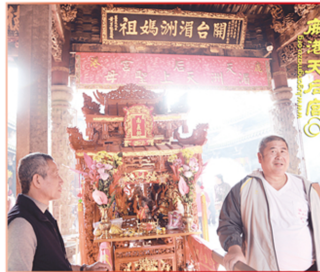
新北市南軒軒寶順宮