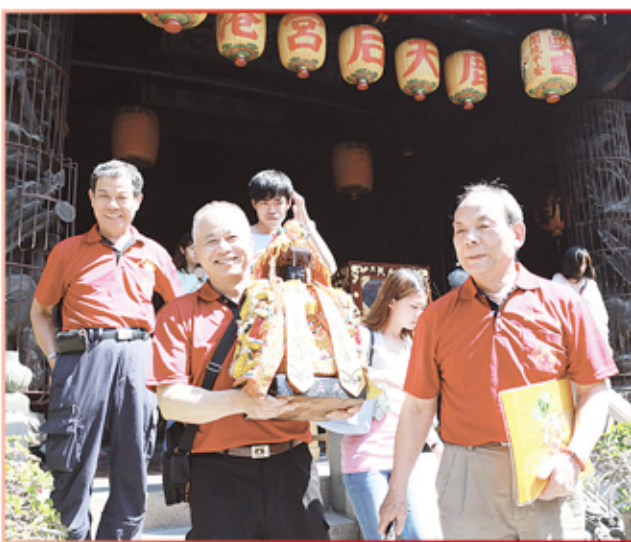
台北市田寮媽祖會進香團