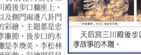
天后宮三川殿後步口獅座上代表忠、孝故事的木雕。

下都很尊敬他。有一天仁傑出外巡視，途經太行山。他登上山頂向下看著雲，對他的隨從說：「我的親人就住在白雲底下。」徘徊了很久，也沒有離去，不禁流下思親之淚。有詩頌曰：『朝夕思親傷志神，登山望母淚流頻；身居相國猶懷孝，不愧奉臣不愧民。』 楊震辭金（廉）的故事是說東漢昌邑縣令王密，為了感謝東萊太守楊震知人善任之恩，夜裡悄悄帶著10斤黃金拜見老師。楊震辭金不受，並說：「我本以為深知你的為人，為什麼你卻對我的為人一無所知呢？」王密便說：「現在夜深人靜，無人知曉。」楊震聞之，勃然大怒，厲聲斥道：「天知、地知、我知、你知，怎麼能說沒有人知曉呢！」時人因此稱楊震為「四知先生」。 莊研育說，楊震後代有家族定居鹿港，緬懷先人，特取「四知堂」的堂號，包括茶莊、中藥舖、滷味店等，看到四知堂就可知主人家一定姓楊。 蘇武牧羊則是代表氣節的故事，漢武帝時，中郎將蘇武奉命出使匈奴，被匈奴單于囚禁並逼降，他飲雪吞毡，堅決不從，後來又將他遣送到北海邊上放牧公羊，說要等公羊產奶後才能放他回朝。蘇武不顧威脅利誘，堅持19年不屈服，最後終於回到了他朝思暮想的故鄉。後人常用「蘇武牧羊」的典故，來表示對志節高尚堅貞的贊頌。 蘇武牧羊的木雕，除了白鬍子老公公手持拐杖牧羊之外，旁邊還刻了一個番兵，高舉右手似在打招呼，構圖很可愛。 莊研育表示，在他帶領導覽天后宮時，通常都會為遊客講述這些木雕、彩繪所賦予的意義，讓大家能夠更貼近先人的智慧結晶，也繼續傳達教化的功能。