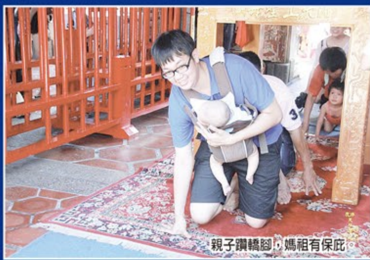
親子鑽轎腳，媽祖有保佑。