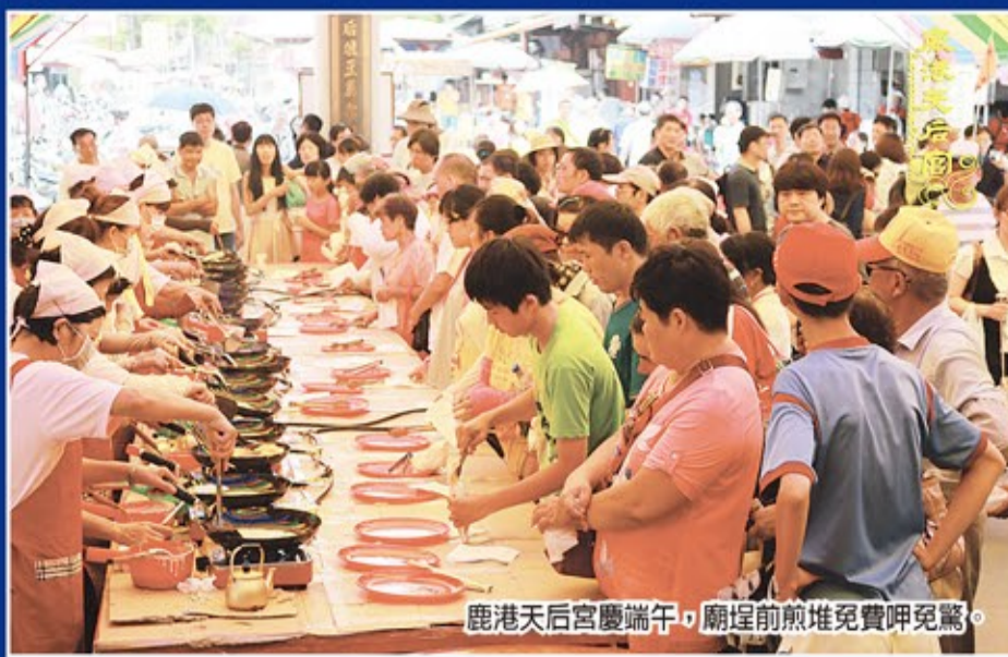
鹿港天后宮慶端午，廟埕前煎堆免費呷兜驚。