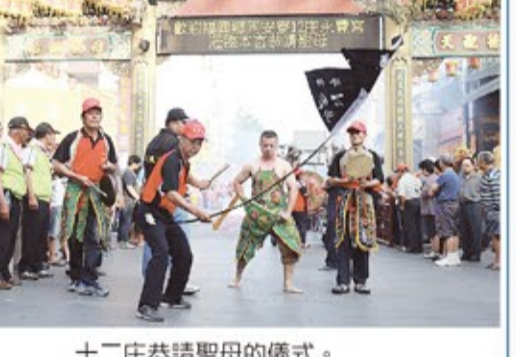
十二庄恭請聖母的儀式。