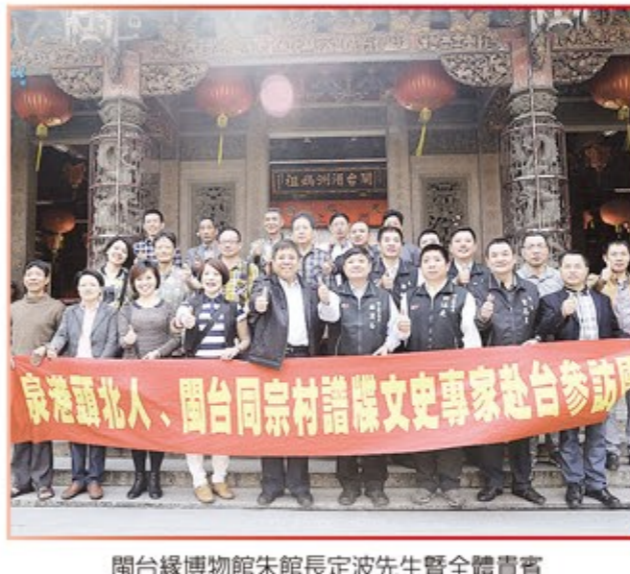
閩台緣博物館館長建春先生暨全體貴賓