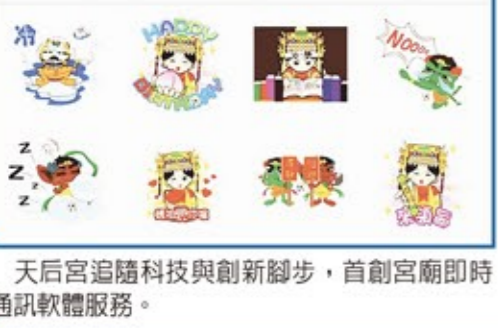
天后宮遍隨科技與創新腳步，首創宮廟即時通訊軟體服務。