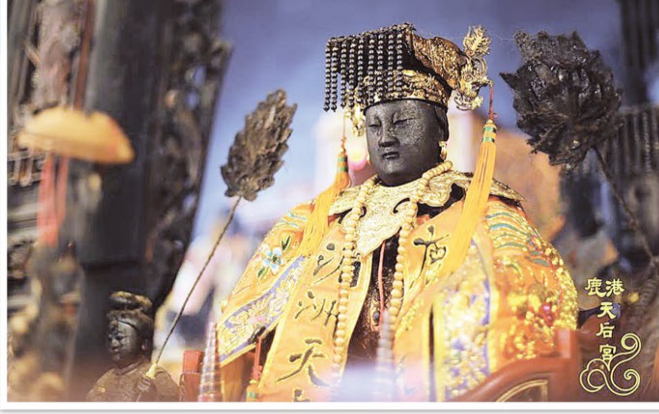
↑天上聖母德澤廣被，聖誕過後降下甘霖為大地解渴。 →信眾虔誠向媽祖祝壽。 ↓工藝看桌獻給媽祖。