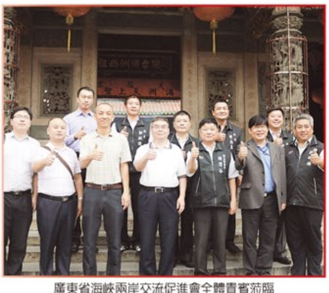
廣東省海峽兩岸交流促進會全體貴賓蒞臨