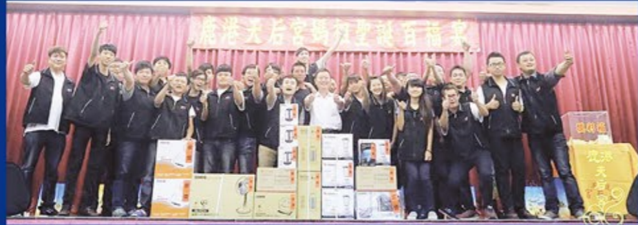
台上抽獎，台下熱鬧滾滾（左圖）。抽到各式獎品的志工歡喜上台合影（上圖）。縣長為大家摸出最大獎電視機（右圖）。