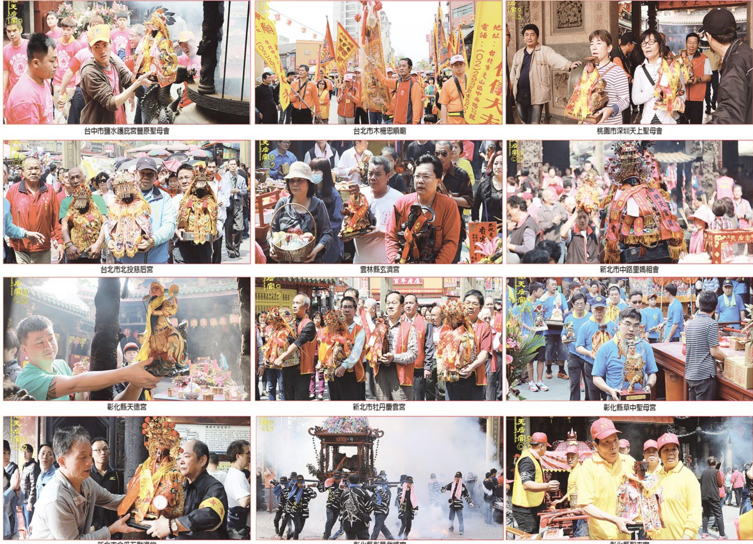
台中市鹽水護庇宮豐原聖母會