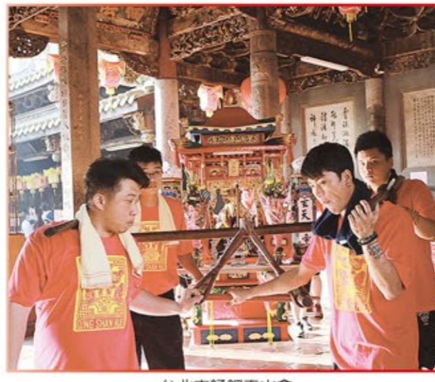
台北市鯤鯓青山會