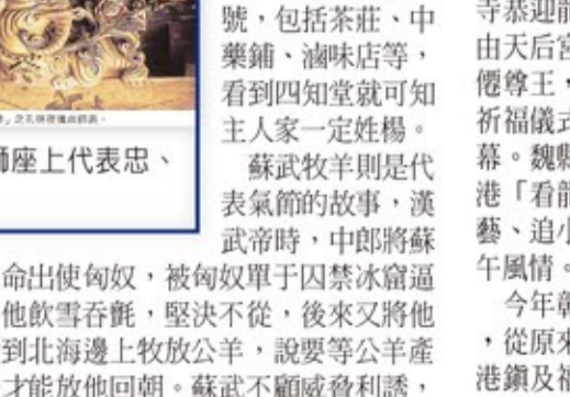
天后宮三川殿後步口獅座上代表忠、孝故事的木雕。

莊研育表示，先人以這些故事作為教化人心的範本，孔明夜進出師表「鞠躬盡瘁（忠）」，木雕的身旁有一名童子幫他提燈照明。故事是說孔明兩次北伐曹魏前，上呈給後主劉禪的奏章表明心跡，「前表開導昏庸，後表審量形勢」。孔明終其一生，都為蜀漢的存亡努力，最後應和了他在《出師表》所說的：「鞠躬盡瘁，死而後已。」孔明忠貞志節非常值得效法。 望雲思親（孝）是狄仁傑望雲思親的故事，狄仁傑為官清廉，秉政以仁，朝野上