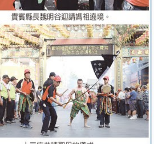
十二庄恭請聖母的儀式。

下部很尊敬他。有一天仁傑外出巡視，途經太行山。他登上山頂向下看著雲，對他的隨從說：「我的親人就住在白雲底下。」徘徊了很久，也沒有離去，不禁流下思親之淚。有詩頌曰：『朝夕思親傷志神，登山望母淚流頻；身居相國猶懷孝，不愧奉臣不愧民。』 楊震辭金（廉）的故事是說東漢昌邑縣令王密，為了感謝東萊太守楊震知人善任之恩，夜裡悄悄帶著10斤黃金拜見老師。楊震辭金不受，並說：「我本以為深知你的為人，為什麼你卻對我的為人一無所知呢？」王密便說：「現在夜深人靜，無人知曉。」楊震聞之，勃然大怒，厲聲斥道：「天知、地知、我知、你知，怎麼能說沒有人知曉呢？」時人因此稱楊震為「四知先生」。 莊研育說，楊震後代有家族定居鹿港，緬懷先人，特取「四知堂」的堂號，包括茶莊、中藥舖、滷味店等，看到四知堂就可知主人家一定姓楊。 蘇武牧羊則是代表氣節的故事，漢武帝時，中郎將蘇武奉命出使匈奴，被匈奴單于囚禁並逼降，他飲雪吞毡，堅決不從，後來又將他遣送到北海邊上放牧公羊，說要等公羊產奶後才能放他回朝。蘇武不顧威脅利誘，堅持19年不屈服，最後終於回到了他朝思暮想的故鄉。後人常用「蘇武牧羊」的典故，來表示對志節高尚堅貞的贊頌。 蘇武牧羊的木雕，除了白鬍子老公公手持拐杖牧羊之外，旁邊還刻了一個番兵，高舉右手似在打招呼，構圖很可愛。 莊研育表示，在他帶領導覽天后宮時，通常都會為遊客講述這些木雕、彩繪所賦予的意義，讓大家能夠更貼近先人的智慧結晶，也繼續傳達教化的功能。