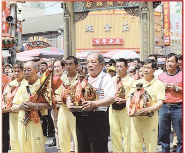
桃園市東興花式鼓樂隊