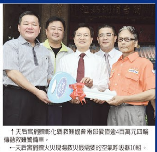
↑天后宮捐贈彰化縣救難協會兩部價值逾4百萬元四輪傳動救難警備車。 ←天后宮捐贈火災現場救災最需要的空氣呼吸器10組。