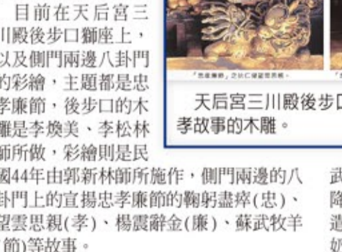
天后宮三川殿後步口獅座上代表忠、孝故事的木雕。