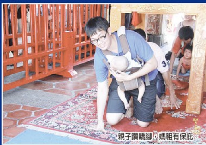
親子躓橋腳，媽祖有保佑。