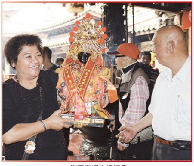
桃園市埔心媽祖會