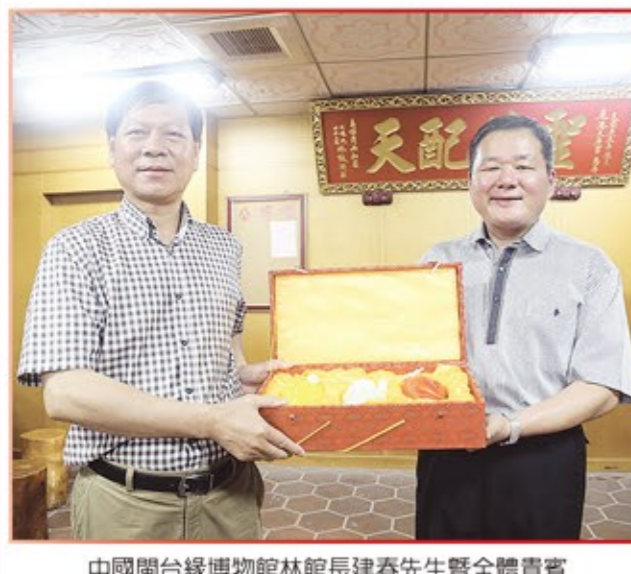
中國閩台緣博物館館長建春先生暨全體貴賓