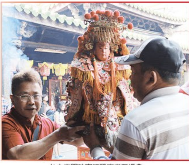
台中市軍功寮福順宮老五媽會