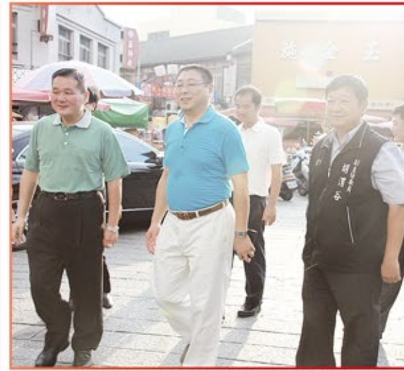
莆田市委副書記賴軍先生暨全體貴賓