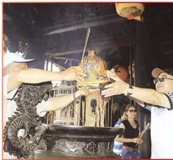
台北市萬善爺功德堂