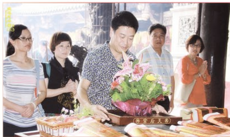
湖南省寧鄉縣宗教文化參訪團