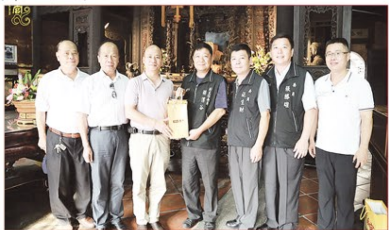
福建晉江深林宮參訪