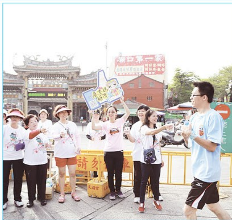
志工成立的茶水加油站，為健跑選手加油打氣。