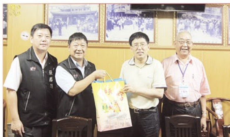
海峽兩岸關係協會貴賓