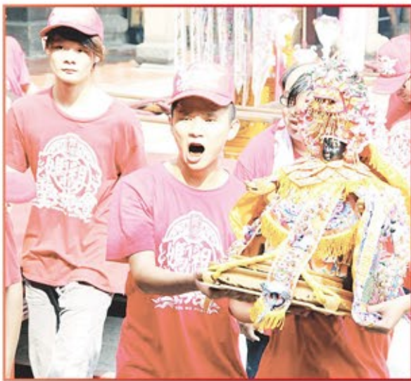
台中市營埔聖母會