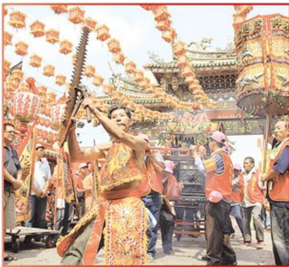
嘉義縣外溪洲慈慧堂