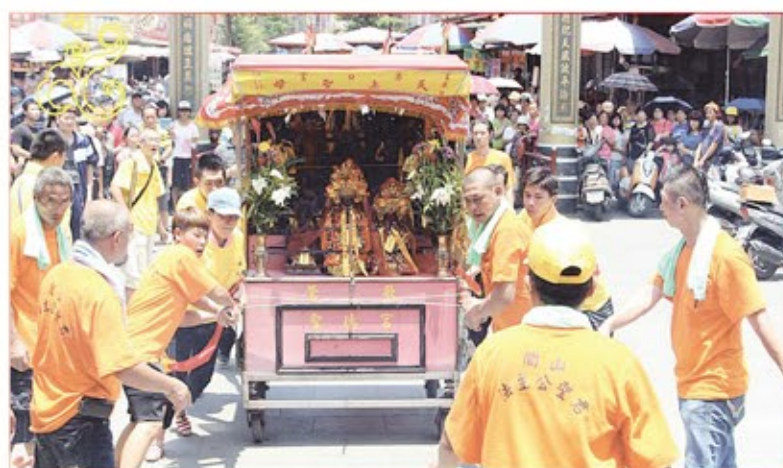
桃園縣關山法主公