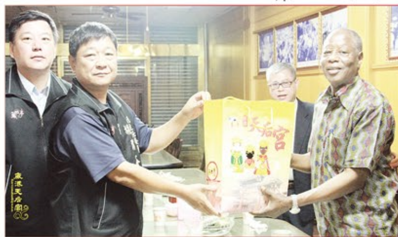
奈及利亞國家藝術及文化署全體貴賓