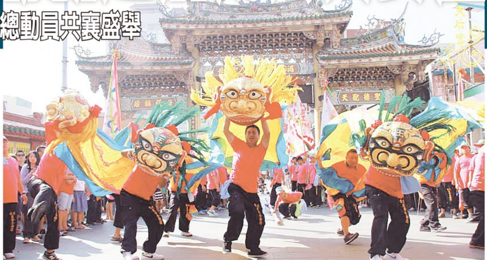
遶境的陣頭來到鹿港天后宮廟前向媽祖致敬。

獲得地方仕紳與信眾踴躍捐資，威靈廟新建完成舉辦入火安座遶境祈福大典，正駕威靈廟大將爺、副駕即是鹿港城隍廟整齊宮城隍爺，陪駕為景靈宮蘇府三王爺，陪駕前順義宮順府千歲、玉皇宮田都元帥、潤澤宮李殿王、聖神廟廣澤尊王；先鋒官為錢江施家大將爺；贊境台中法壇轎班會、大里吳王會轎班會、彰化觀音宮轎班會，遶境路線行經鹿港鎮內五十多個寺廟，許多大小宮廟都出轎慶讚，可說是傳統小鎮的寺廟界菁英盡出，而參加的陣頭來自台灣各地，包括一般比較少見的宜蘭國光樂旗儀隊、台南東方藝術團跳鼓陣、台北慶寮金獅團等，吸引許多信眾與遊客駐足觀賞。