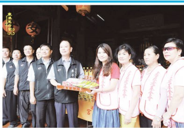
鹿港天后宮關懷獨居老人捐贈普度物資(上圖)。大家努力傳遞愛心，集合信眾的捐贈送給弱勢族群(下圖)。