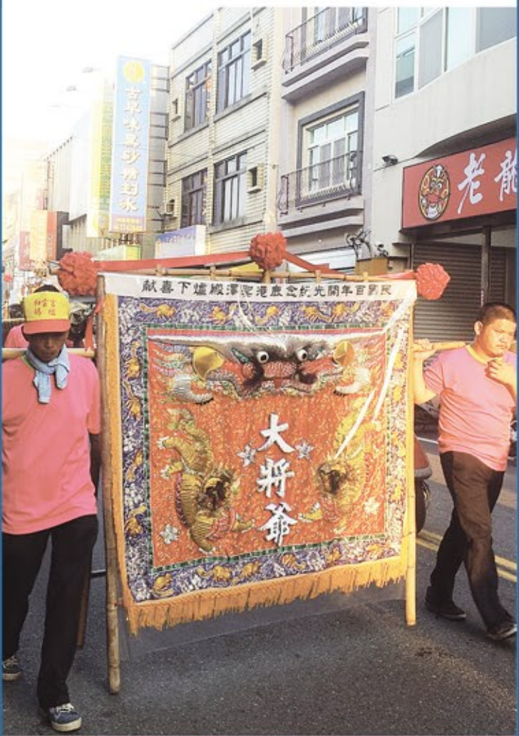
鹿港威靈廟大將爺入火安座遶境祈福，場面盛大熱鬧。