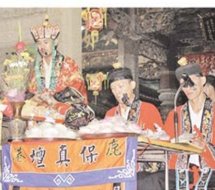
↑鹿港天后宮舉辦中元節法會為民消災祈福。

廟內琳瑯滿目各式各樣大批普度的供品，在社會善心人士響應集資，每份600元認養之下，供品逐年增加，有數百斗白米及1千7百多份的沙拉油、醬油、糖、鹽、雞絲麵、肉鬆、米粉、麵條、罐頭等民生物資，全數委請老五老基金會轉發給彰化縣內福興、鹿港、和美、伸港、線西等五鄉鎮的獨居老人、低收入戶與經濟弱勢族群來吃平安。