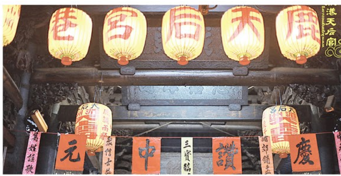
鹿港天后宮慶讚中元為傳統習俗。