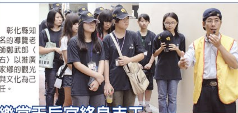
樂當天后宮終身志工