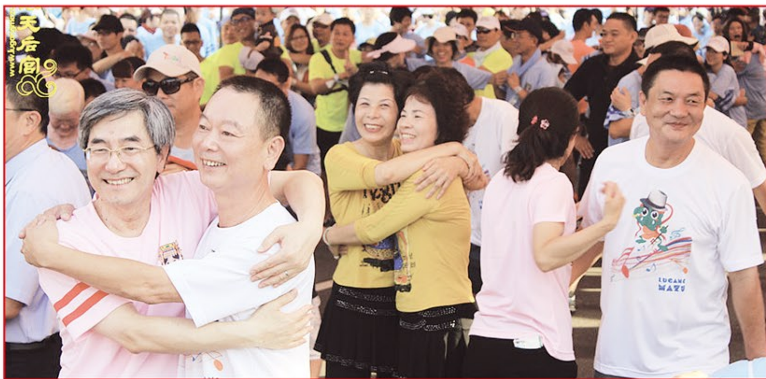
擁抱是無聲的語言，能帶來正向能量。