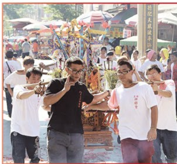
新北市五堵神將會