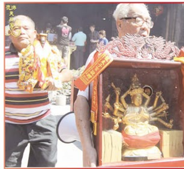
桃園市十八手觀音佛祖廟