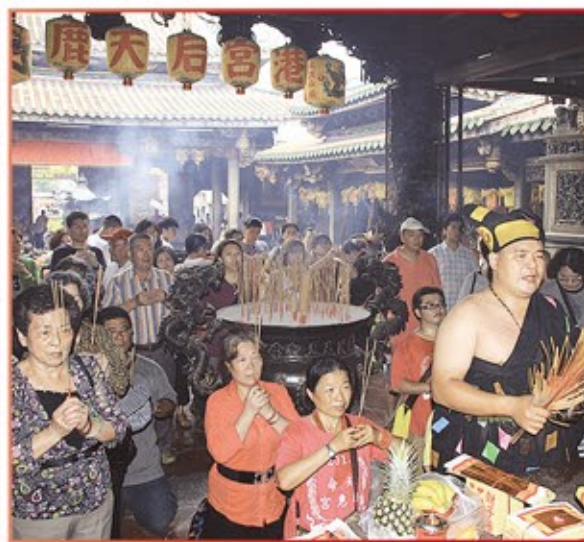
台北市天命德惠宮