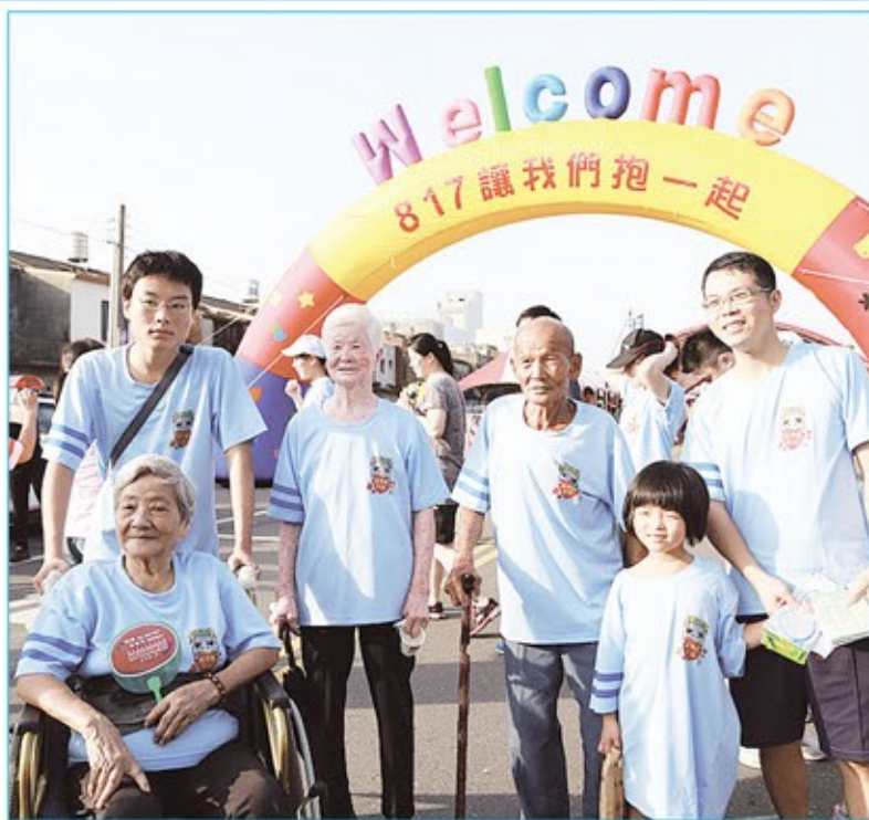
民眾熱情參加活動，出現許多全家一起來的畫面。

今年除了擁抱行動外，參與民眾、家庭還共同做一件善事，透過公益路跑五公里或為愛健走一公里的方式，一同為獨居長者送餐服務募集環保餐盒。老五老基金會表示，過去獨居送餐服務採用最普遍的紙類便當盒，但一年累積製造三萬六千多個餐盒，堆疊如同一座101高樓，為了照顧獨老兼顧環保，於是老五老特製環保餐盒，預計募集3000個環保餐盒，改善1000位獨居長輩送餐服務。