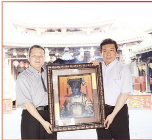
陸委會副主委張顯耀