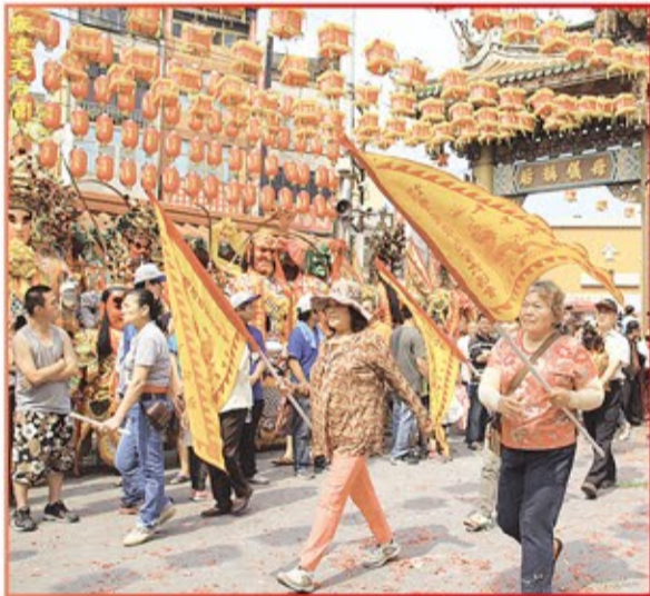
台中市厚德季六媽會