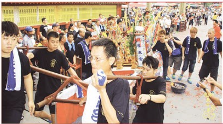
台中市黃家池府千歲