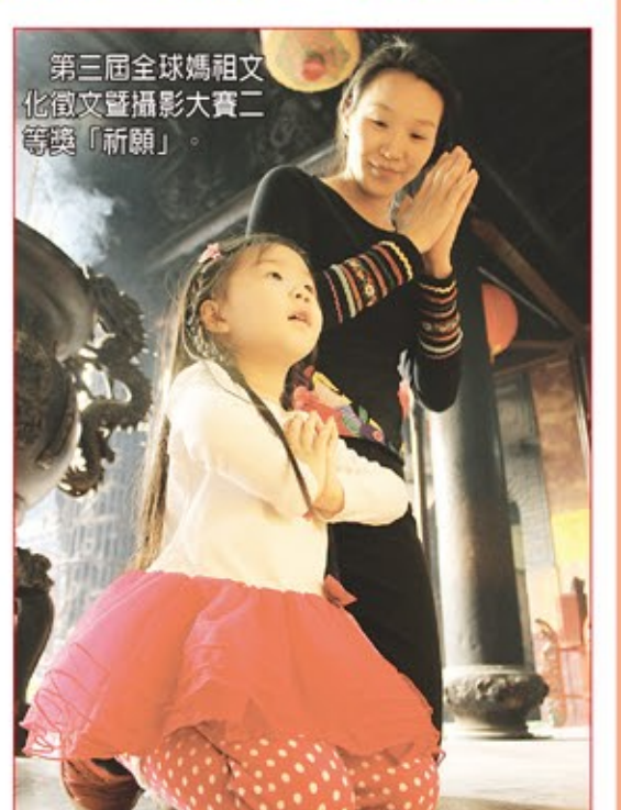
第三屆全球媽祖文化徵文暨攝影大賽二等獎「祈願」。