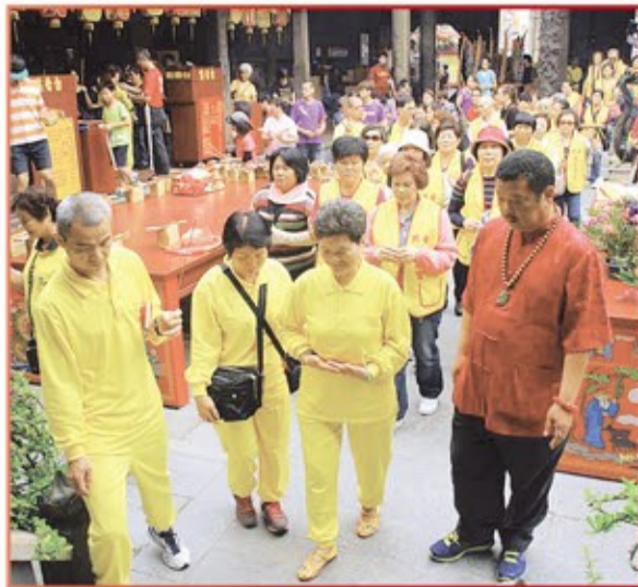
台北市興安天后宮