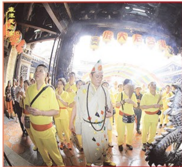
台中市無極懿天宮