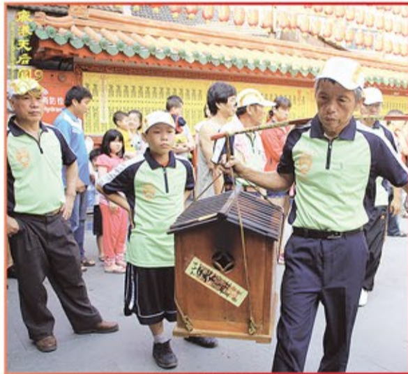
彰化縣劉厝天聖宮