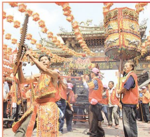
嘉義縣外溪洲慈慧堂