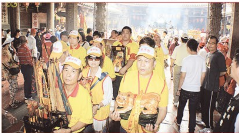
新北市江仔翠聖天宮