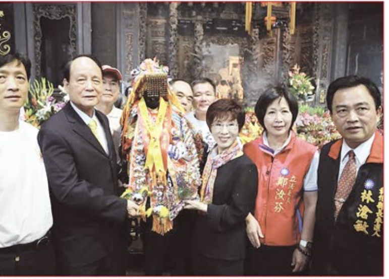
立法院副院長洪秀柱(右三)、海基會董事長林中森等人，在鹿港天后宮恭送「煌三媽」媽祖回鑾昆山慧聚天后宮。

兩岸媽祖廟交流 鹿港天后宮媽祖分靈開先河 創建於明末的彰化鹿港天后宮，是台灣唯一奉祀湄洲祖廟開基媽祖神尊的媽祖廟，和對岸媽祖廟交流密切。 鹿港天后宮所在的鹿港鎮在清朝時被設爲港口，位於台灣中部，與中國大陸來往密切，對航港口爲中國大陸泉州，許多泉州人到鹿港做生意。清康熙時，將軍施琅從湄洲開基媽祖廟