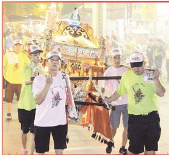
彰化縣秀水鄉協靈堂