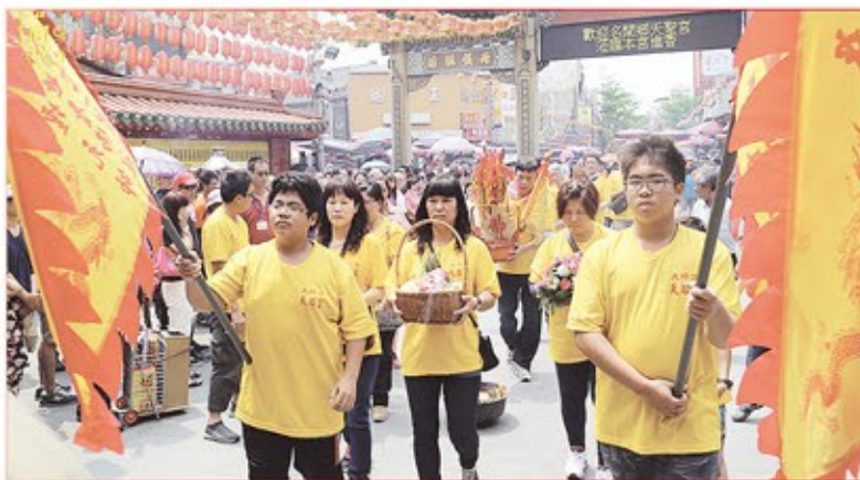
高雄市大坪頂天后宮