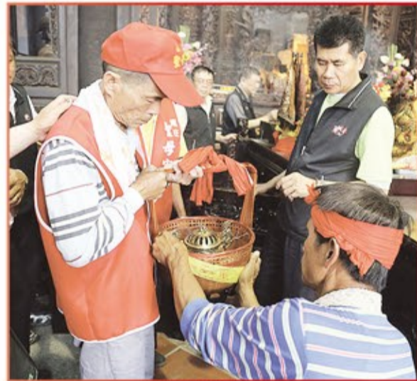
高雄市尾庄聖母宮