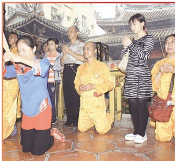
新竹縣金鼎山開天宮