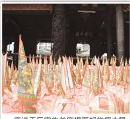
鹿港天后宮的普度場面相當盛大隆重。