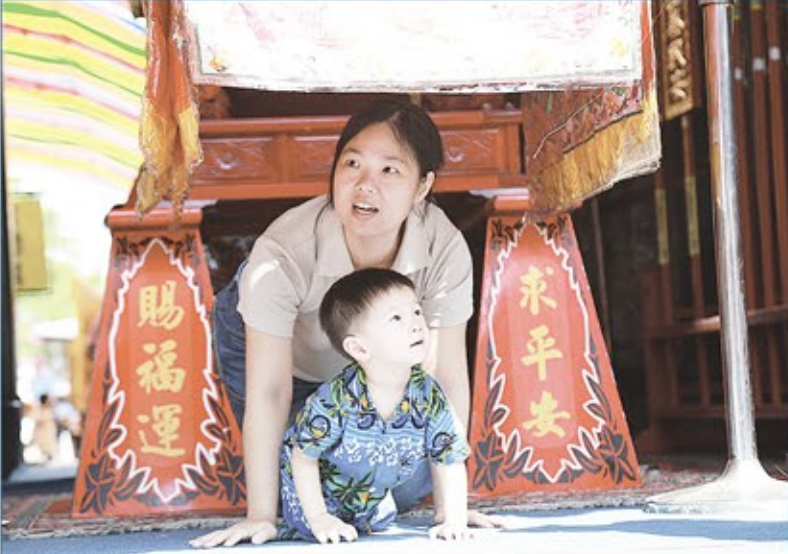
↑媽媽帶著小寶貝躡轎腳，祈求媽祖保平安。 •端午節恭請古大媽坐鎮在三川殿前，供民眾躡轎腳祈福。 ↓志工媽媽煎「煎堆」，展現鹿港傳統好滋味。