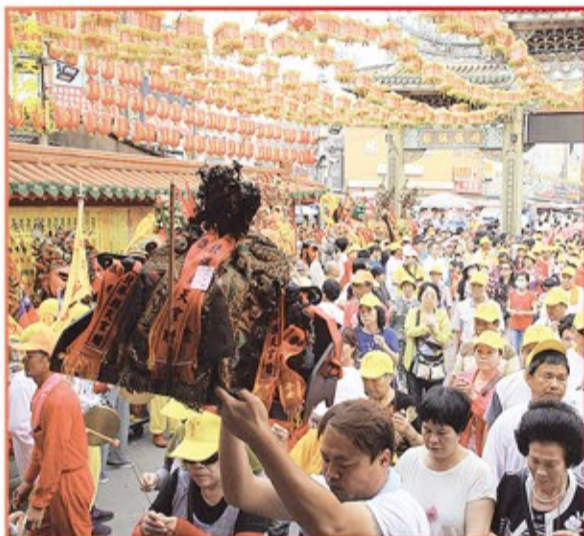
新竹市南寮慈聖宮