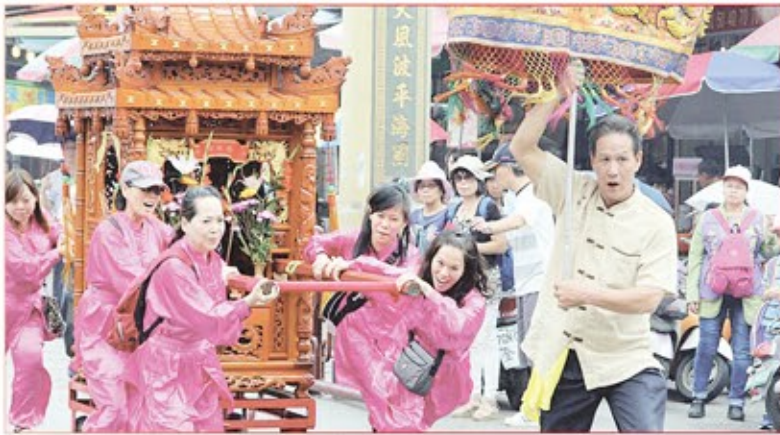
新北市三清慈航宮