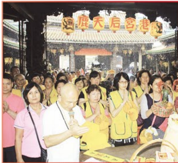
新竹縣普元佛道院