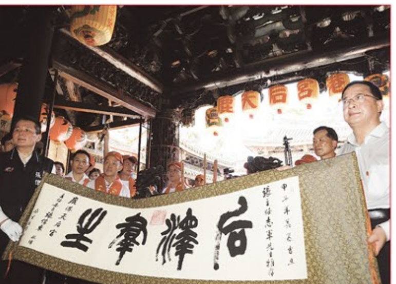
鹿港天后宮致贈蓋有千年媽祖寶墨寶寶的書法作品給國台辦主任張志軍，由國台辦交流局長程金中代表接受。