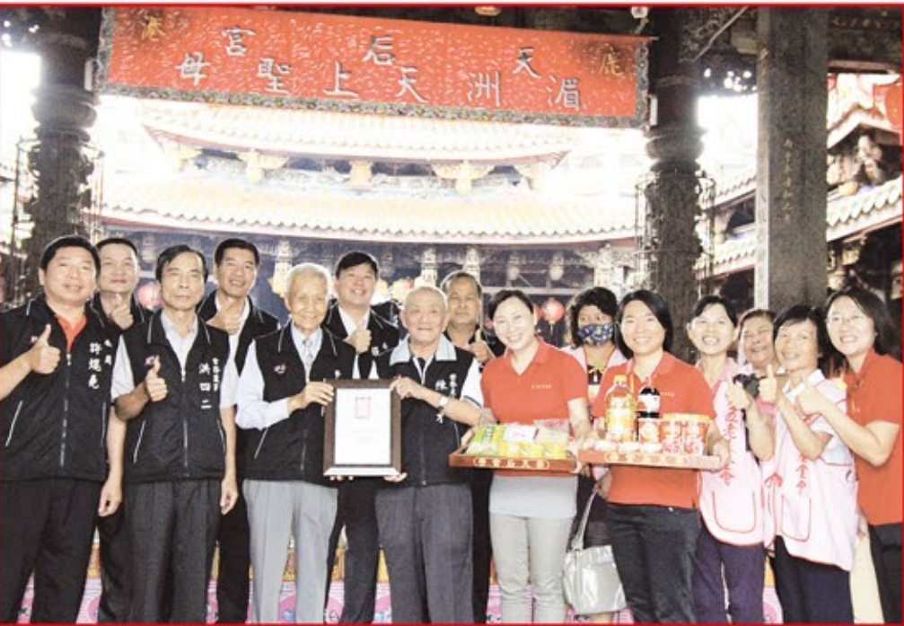
鹿港天后宮每年捐贈物資關懷地方獨居老人。