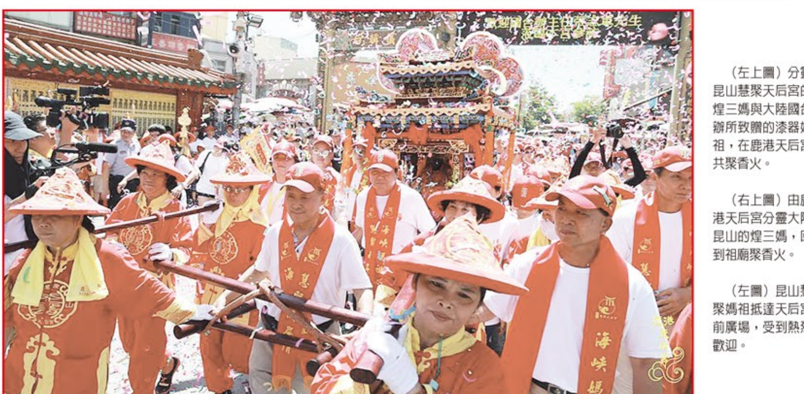
(左上圖)分靈昆山慧聚天后宮的煌三媽與大陸國台辦所贈的漆器媽祖，在鹿港天后宮共聚香火。