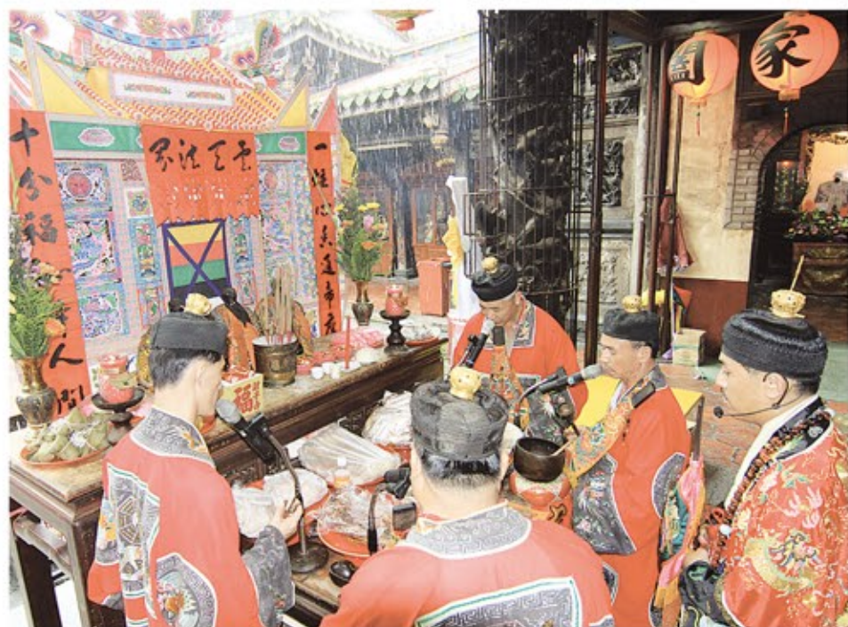
鹿港天后宮每年會在於中元節舉辦普度大法會。

欲參加消災祈福法會者，功德金每人600元，請提早報名，以便疏文作業。參加方式可至天后宮中殿服務台辦理，或是利用郵政劃撥，戶名：鹿港天后宮，帳號21613083（劃撥單上通訊欄請註明中元普度），線上刷卡請至官網-信眾服務-添香油錢。