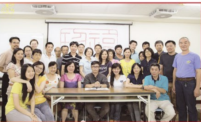
鹿港天后宮文化工藝研習班第三期結業，同學與老師大合照。