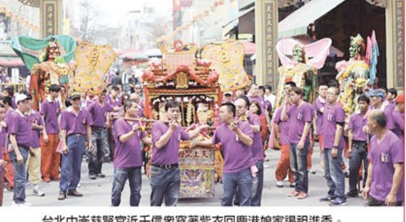
台北中崙慈賢宮近千信眾穿著紫衣回鹿港娘家謁祖進香。

無阻，盛情感人，廟方特向各位貴賓家戶平安喜樂賺大錢。致上最熱烈的歡迎，祝福香火鼎盛，