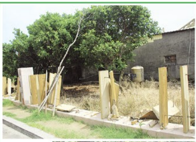
斥資近三千萬元施設的鹿港天后宮停車場，南面約三、四百米的混凝土長條形石板圍籬，多處被倒車撞得東倒西歪。

方意見，施設完成廟方才發現根本華而不實，停車場像公園，未能考量到終年香火鼎盛的鹿港天后宮需要的是停車場，因而，每到週末、假日，數萬遊客湧進鹿港之時，完全免費提供使用的停車場，車輛已是一格難求。