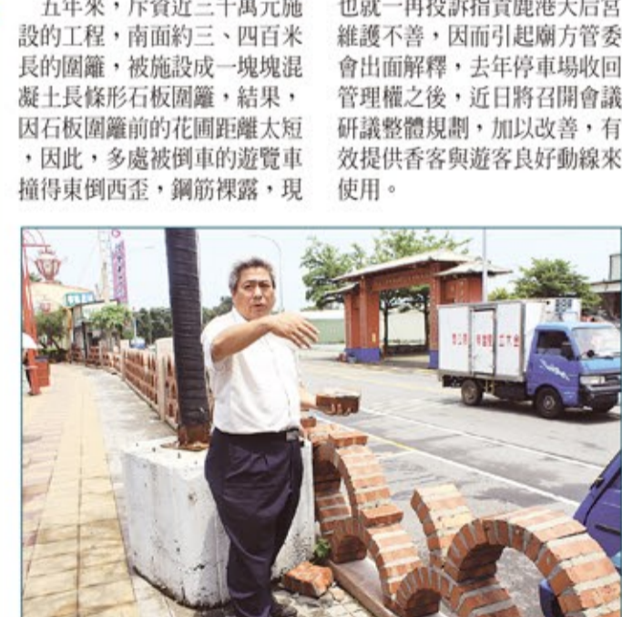
鹿港天后宮停車場的紅磚牆拱門型圍籬，常遭人為破壞，到處慘不忍睹。