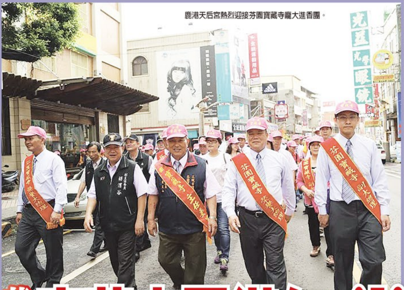
鹿港天后宮熱烈迎接芬園寶藏寺龐大進香團。