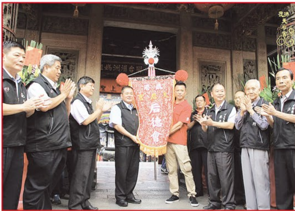
鹿港天后宮成立青年團后德會授旗。