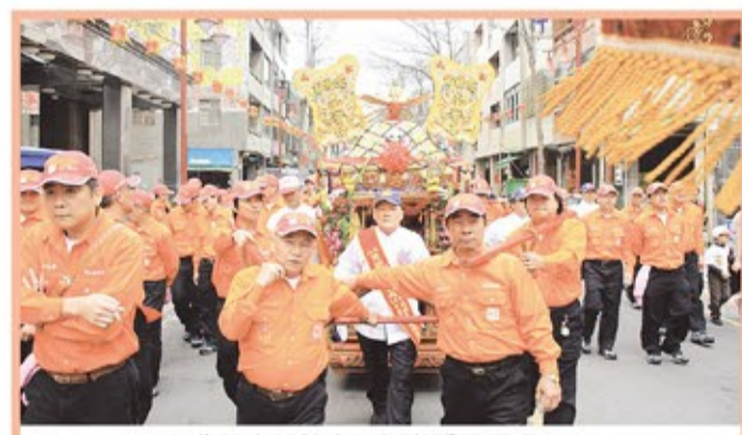
台北松山慈祐宮每年進香場面盛大。