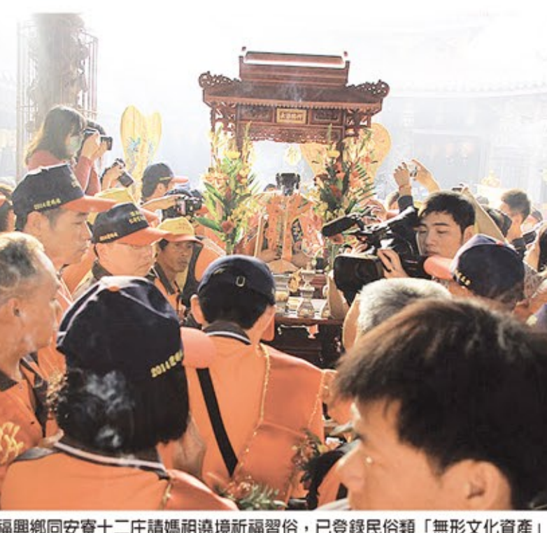
福興鄉同安寮十二庄請媽祖遶境祈福習俗，已登錄民俗類「無形文化資產」。

「十二庄請媽祖」，已延續一百八十三年，經福興鄉公所輔導福安宮提報彰化縣文化局，通過登錄民俗類「無形文化資產」；登錄保存單位為福安宮，以維護保存這項珍貴的宗教民俗活動。