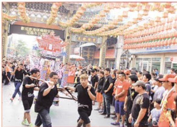
鹿港鎮橋樑順安宮