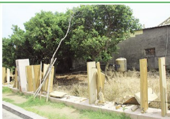
斥資近三千萬元施設的鹿港天后宮停車場，南面約三、四百米的混凝土長條形石板圍籬，多處被倒車的遊覽車撞得東倒西歪。

五年來，斥資近三千萬元施設的工程，南面約三、四百米的圍籬，被施設成一塊塊混凝土長條形石板圍籬，結果，因石板圍籬前的花園距離太短，因此，多處被倒車遊覽車撞得東倒西歪，鋼筋裸露，現