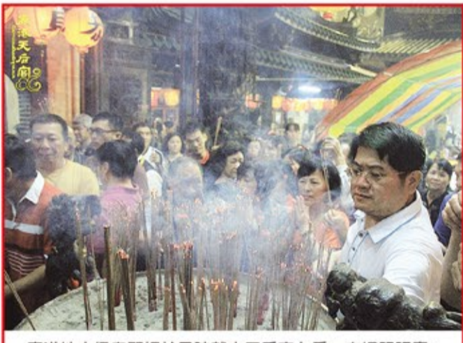
鹿港地方信眾習慣於子時就來天后宮上香，向媽祖祝壽。

主祀湄洲天上聖母的鹿港天后宮，歡慶農曆三月二十三媽祖聖誕，在廟內除誦經、八音吹閣之外，更依古禮隆重舉行媽祖生一〇五四年聖誕千秋祝壽系列活動，恭宴傳統藝術看桌、花粉桌、及公演三天歌仔戲慶媽祖，下午三時團拜後，六時許開始分贈一千台斤的大壽龜鳳梨酥，與一千份麵線給信眾帶回家吃平安，共慶媽祖德澤，大家踴躍排隊領取，場面隆重溫馨。