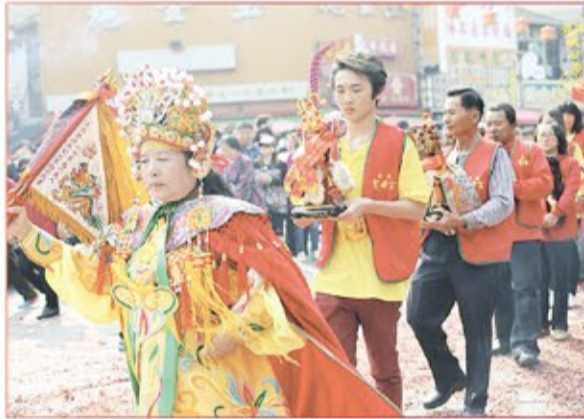
高雄市無極聖母宮