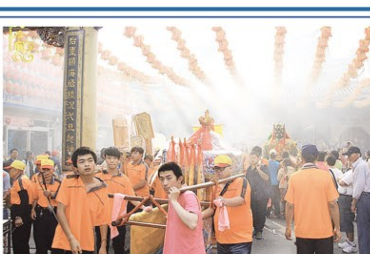
同安寮十二庄請媽祖遶境場面盛大。