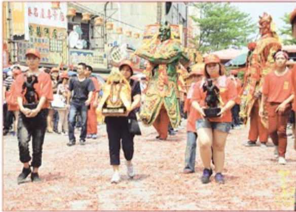
雲林縣潭西保天宮