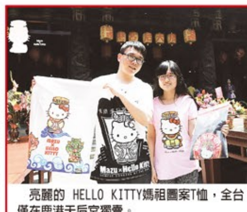
亮麗的 HELLO KITTY媽祖圖案T恤，全台灣僅在鹿港天后宮獨賣。

一位來自嘉義的蔡小姐是超級HELLO KITTY迷，對每件T恤都愛不釋手，最後買了十件。她說，除了自己穿，也可以送人，是最佳伴手禮。來到鹿港天后宮，除了燒香拜媽祖，還有有限版的HELLO KITTY媽祖圖案T恤，很多遊客歡喜選購，直稱「真是不虛此行！」