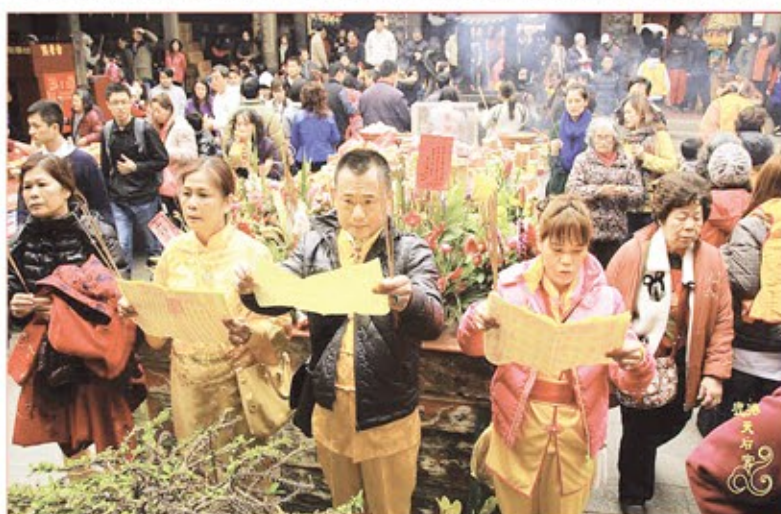
台北市舊莊天后宮