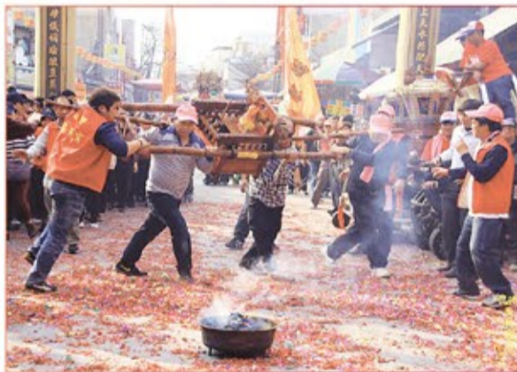
台北市艋舺禮天宮