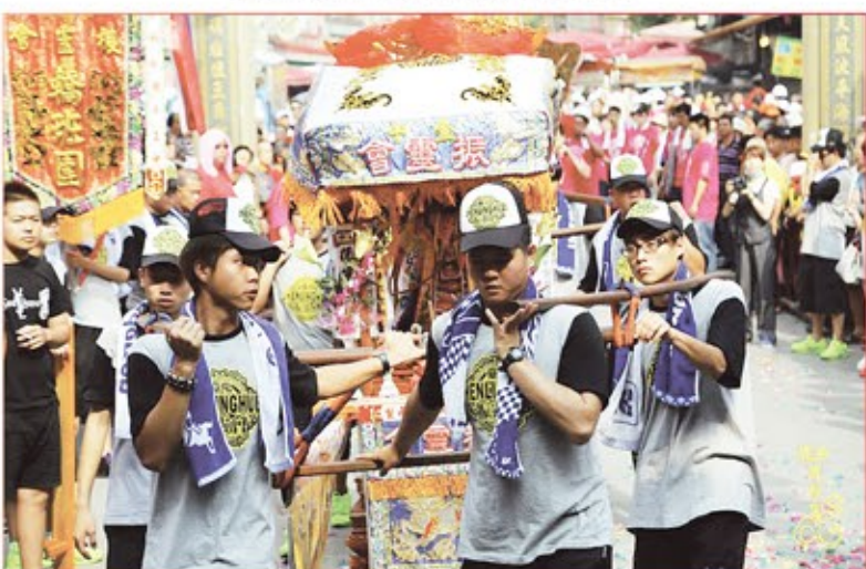
台中市鹽水護庇宮豐原聖母會