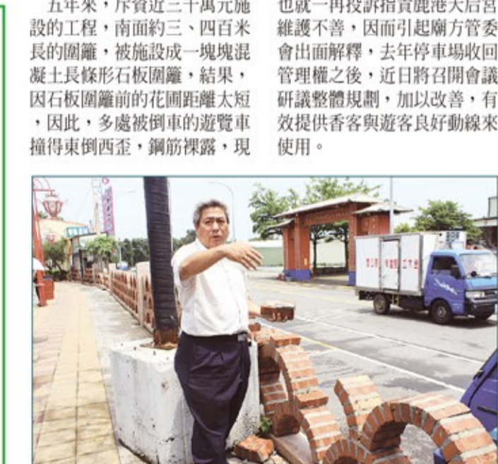
鹿港天后宮停車場的紅磚牆拱門型圍籬，常遭人為破壞，到處慘不忍睹。