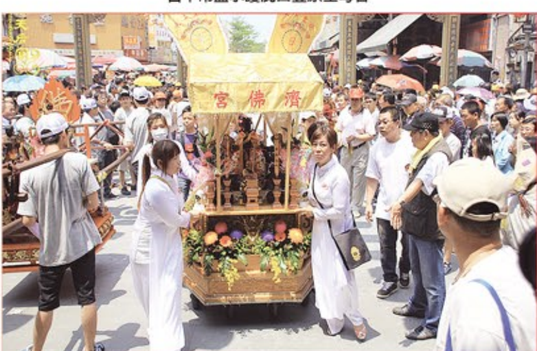
台南市玉旨西湖濟佛宮