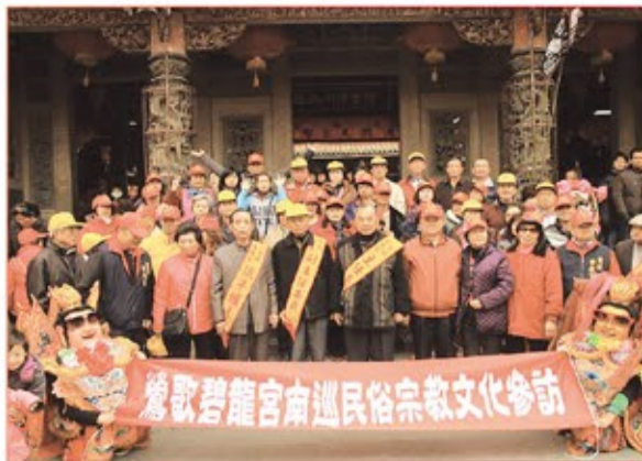
新北市鶯歌碧龍宮