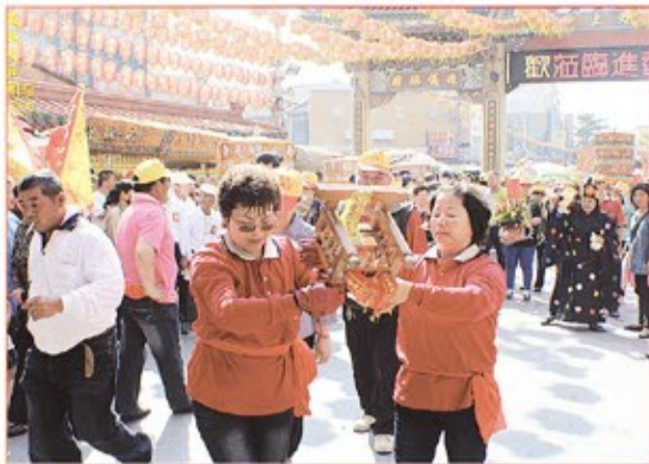
雲林縣鹿寮朝鳳宮