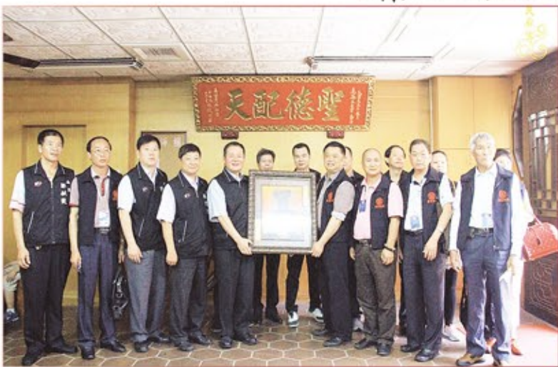
廣東省媽祖文化交流協會暨全體貴賓