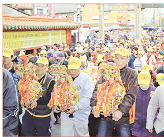
6. 桃園縣中壢市仁海宮。