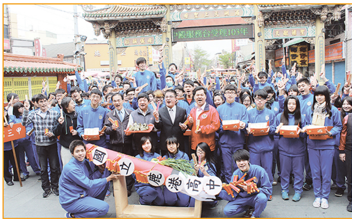
國立鹿港高中210位應屆畢業普通科學生跳躍歡愉，有信心考上心目中理想學校。

龐大學生群與官將首陣頭抵達天后宮時，吸引大陸遊客及40多位海外華裔青年台灣觀摩團的好奇與羨慕，當官將首在廟口廣場演出威武架勢十足的舞步之後，立即被要求與遊客群合影留念留念，官將首學生也樂於展現