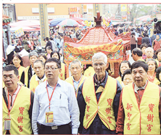
2. 彰化縣田中鎮新聖宮(寶樹宮)恭請聖母。