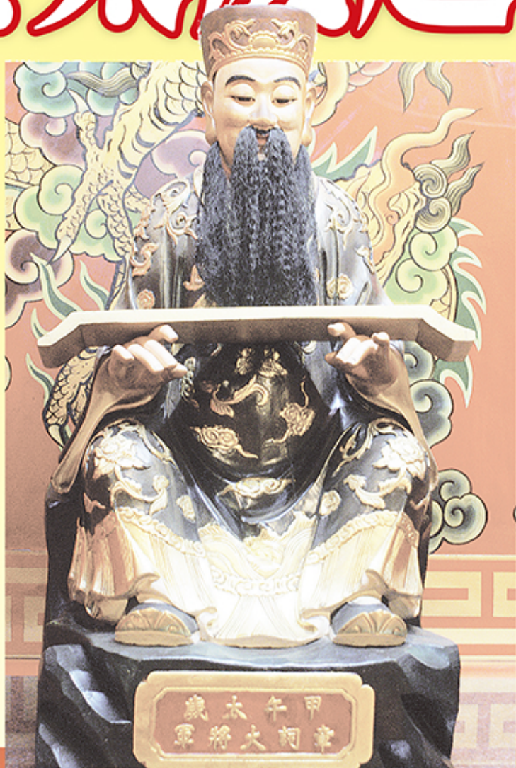
→鹿港天后宮太歲廳中的甲午年值年太歲章詞將軍。