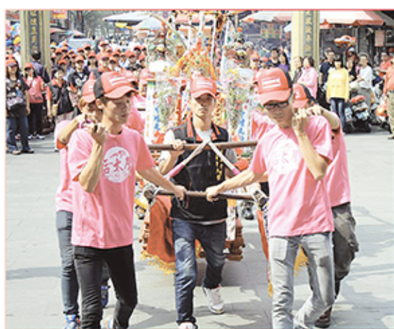
3. 苗栗縣後龍鎮埔頂番仔園濟公會。