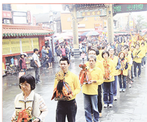
4. 新北市土城區慈聖宮。