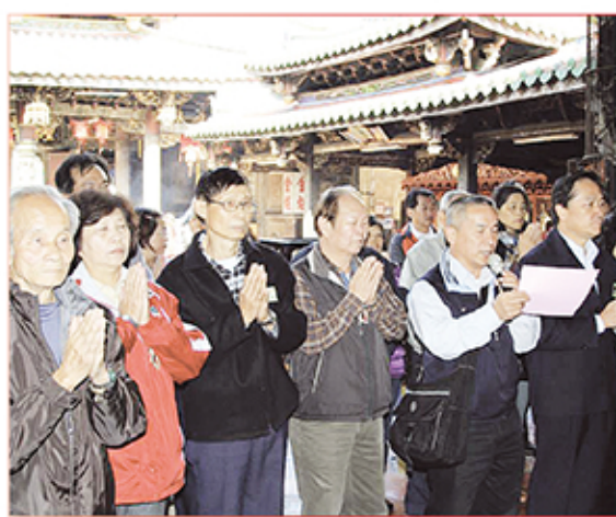
5. 新竹縣關西鎮太和宮。