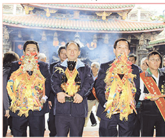
1. 台北市中和區廣濟宮恭送聖母回鑾。