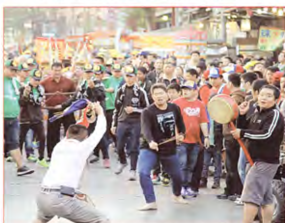
8. 彰化縣福興鄉番社村聖安宮。