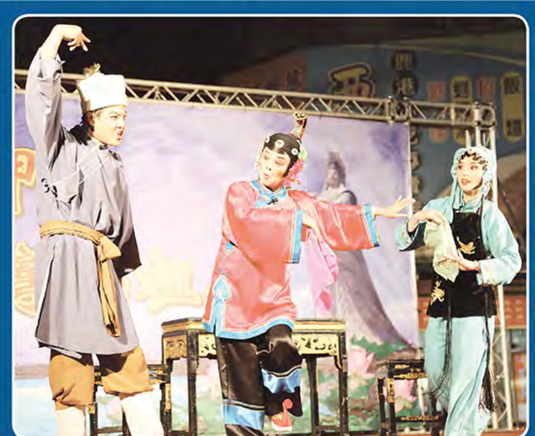
泉州市高甲戲劇團，節目生動精彩。

寒冬仍有好戲上場!是由(大陸第25屆梅花獎劇組首獎得主)國家一級演員陳娟娟小姐領軍國家級泉州市高甲戲傳承中心，12月10日晚間在鹿港天后宮前廣場舉行首演，劇目精彩，雖然當晚正值寒流來襲，冷風颯颯，但並未減熄現場數百位觀眾看戲熱情，給予從對岸來的高甲戲團最熱烈的掌聲鼓勵。 高甲戲又名「戈甲戲」、「九角戲」、「大班」、「土班」，最初是從明末清初閩南農村流行的一種裝扮梁山英雄、表演武打技術的化裝遊行發展起來的劇種，也是閩南諸劇種中流播區域最廣、觀眾面最多的一個地方戲曲劇種。它的足跡曾遍佈於晉江、泉州、廈門、龍溪、台灣等閩南語系地區。 泉州市高甲戲劇團成立於1951年11月，其前身為泉州大眾劇社，劇團曾幾次晉京獻演傳統劇目及現代戲，尤以《連升三級》及《丑角小戲》，引起轟動。該劇團也多次來台，曾在金門、高雄等地演出，場場轟動。 鹿港天后宮主委張偉東表示，被列為大陸國家級非物質文化遺產的泉州高甲戲劇團，此次受邀來台，第一站就安排在鹿港天后宮，為讓本地觀眾感受到高甲戲魅力，特別帶來許多經典劇目，包括桃花搭渡、姘婆打、雲安點將、界樹下、管甫送等，幕幕精彩，以饗鹿港地區鄉親。