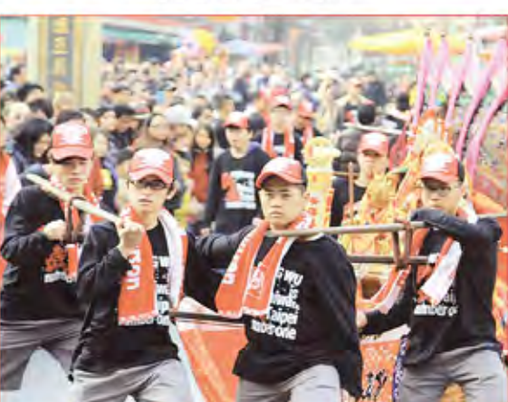
7. 台北市信義區弘武館。