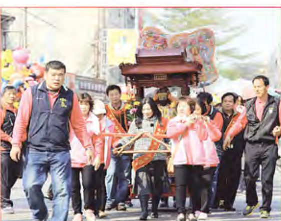
5. 鹿港鎮頂番里玉安宮。