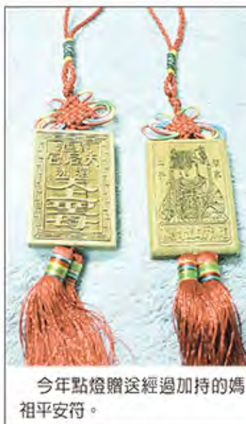
今年點燈贈送經過加持的媽祖平安符。

廟務人員會為其另寫名牌，安置於太歲廳之壁上，並於每月初一、十五邀請誦經團誦經祈求信徒四時無災、八節有慶、運好財來、閭家平安，並於每年農曆12月24日送神，誦經答謝太歲星君一年庇佑。 另外還有祈求元辰光彩、補運助氣的光明燈，廟方會將點燈信眾的姓名資訊書寫於燈上，拜請神明保佑，以點亮光明增添元辰光采，期許為個人補運助氣、增福益壽，避免運途不順、官災、小人等。 文昌燈祈求金榜題名、工作升遷，點文昌燈旨在於祈求文昌帝君的加持庇佑，期許個人在求學路上或求職路上能智慧大開、步步高昇，不僅適用於讀書人，也適用於一般的上班族。 天后宮的拜斗廳，近年來也深受信眾擁戴，因場地容納有限，往往都是最早額滿。點拜斗燈係按個人生辰開斗，以祈求驅邪押煞、延命保安，同時也可驅邪事業發達、投資倍利。以及閩家平安斗燈組，可祈求閩府康泰，迎祥納福；斗燈組集合民間信仰所常見之法器，如斗、剪刀、劍、燈、傘、簪、尺、秤、白米、鏡子等物品，依其特性與外觀，或象徵生息不盡，或招財驅邪，或調理人心，破除障障...等各種意義，天后宮特別備有大型的閩家平安斗燈組，以保佑居家生活平安順利。 還有限量的財運亨通斗，保佑財源廣進、日日生財、生意興隆，是公司行號與企業界的最愛，每年都供不應求，而且多半年年都來續點，顯見公司是賺錢的。 未婚男女為求好姻緣，可點月老姻緣簿，由廟務人員會填寫「姻緣疏文」上奏月老星君，擇良辰吉日於月老廳舉行儀式，完成姻緣簿登記，為信眾祈賜良緣。 鹿港天后宮近10萬盞燈，除了財運亨通斗視位置不同，8千元起跳至萬元，以及閩家平安斗燈組一座3千元之外，其餘點燈都是6百元，可獲得廟方準備的精美紀念品台灣梢楠木雕刻的媽祖寶像平安符，並經過媽祖加持、過爐，奉在家中或是懸掛車上可保平安。 鹿港天后宮新春點燈方式如下： 一、可利用郵局劃撥 劃撥帳號：21613083、戶名：鹿港天后宮。 若以劃撥的方式辦理點燈，可至全省郵局辦理，廟方收到劃撥帳號確後，會將預點點燈的感謝狀及兌換券寄給當事人。 ※填寫方式：請註明清楚個人資料(匯款人、住址、出生年月日、連絡電話)及點燈種類(如：文昌燈)、數量；若以郵局寄現金袋的方式，請務必註明清楚。