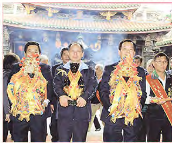
1. 台北市中和區廣濟宮恭送聖母回鑾。