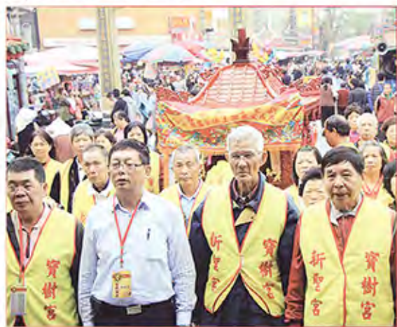
2. 彰化縣田中鎮新聖宮(寶樹宮)恭請聖母。