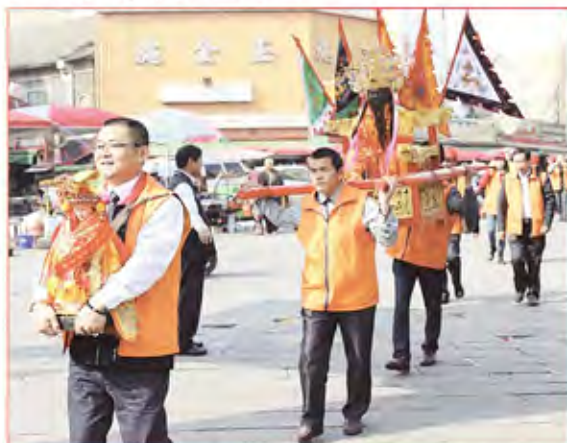
2. 福建漳州市天妃宮。