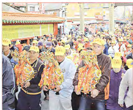
6. 桃園縣中壢市仁海宮。