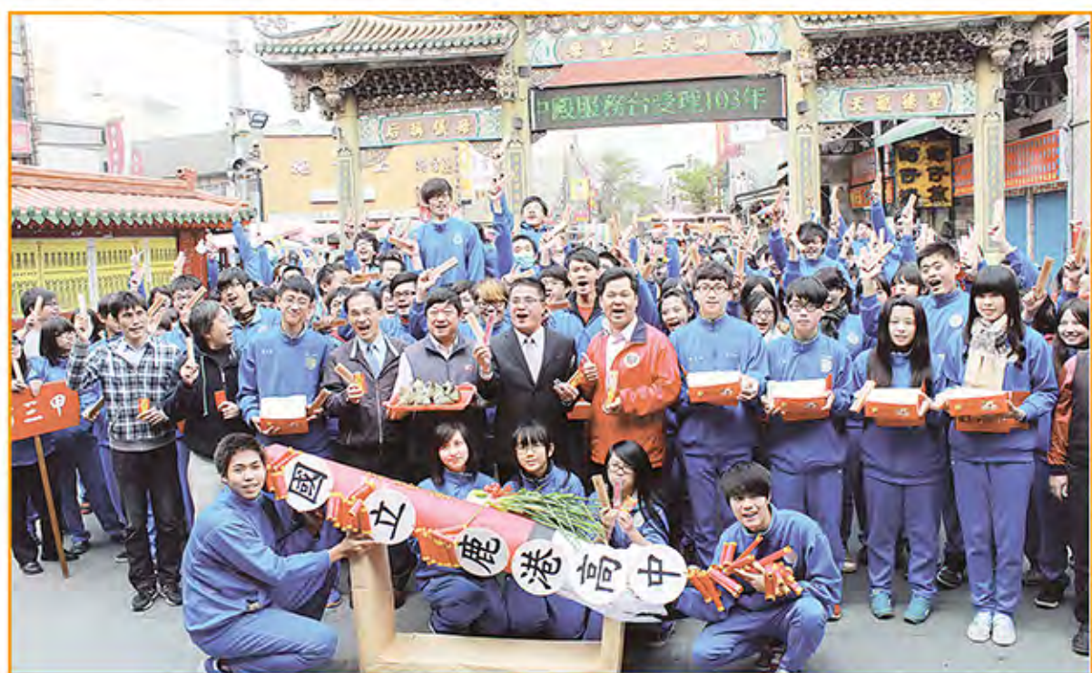
國立鹿港高中210位應屆畢業普通科學生跳躍歡愉，有信心考上心目中理想學校。

龐大學生群與官將首陣頭抵達天后宮時，吸引大陸遊客及40多位海外華裔青年台灣觀摩團的好奇與羨慕，當官將首在廟口廣場演出威武架勢十足的舞步之後，立即被要求與遊客群合影拍照留念，官將首學生也樂於展現