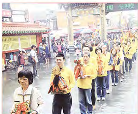
4. 新北市土城區慈聖宮。