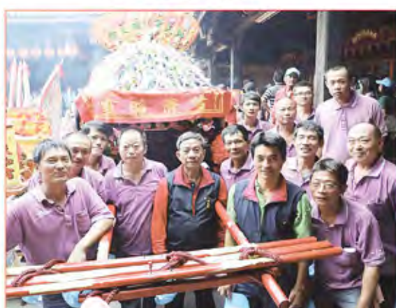
6. 彰化縣福興鄉三和村天和宮謁祖進香。