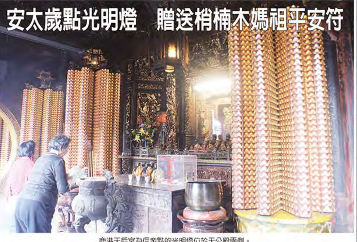
安太歲點光明燈 贈送梢楠木媽祖平安符