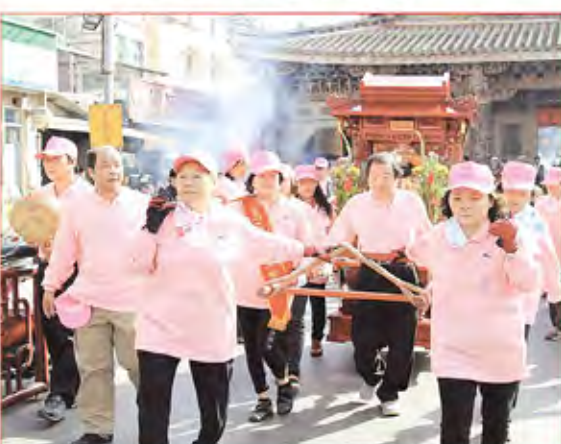
3. 鹿港鎮頭前埔尾順天宮恭請聖母。