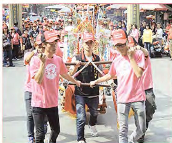
3. 苗栗縣後龍鎮埔頂番仔園濟公會。