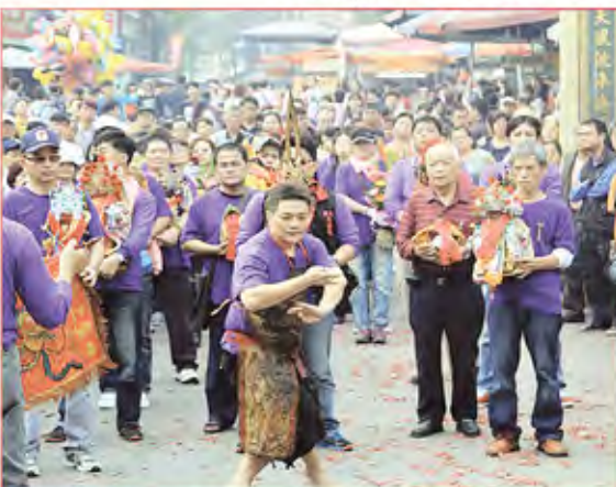
1. 新北市中和區北極真龍殿。