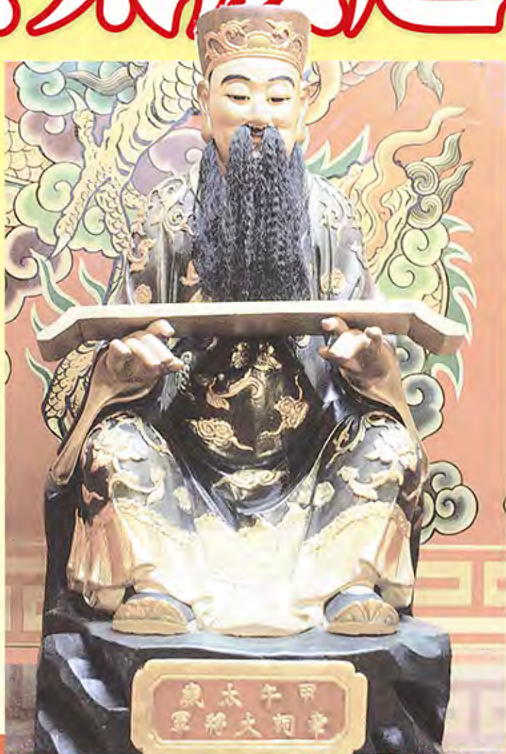
→鹿港天后宮太歲廳中的甲午年值年太歲章詞將軍。