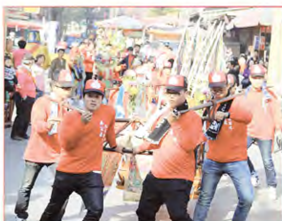
4. 鹿港鎮洋厝里觀聖宮。