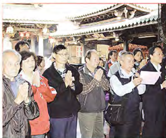
5. 新竹縣關西鎮太和宮。