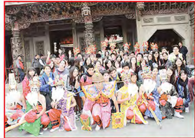
16位男女學生組成的官將首為同學加持，也贏得大陸客及海外華裔青年台灣觀摩團的好奇與羨慕。

鹿港天后宮製作2014年新春賀聯，是敦請鹿港書法大師粘文意揮毫「鴻禧雲集」，天后宮潮州天上聖母寶像與吉慶的大紅色牡丹花背景，貼在家戶門牆更加喜氣洋洋。這張賀聯贈送在地的鹿港、福興鄉的鄉親每戶一份，另外埔鹽、秀水也酌量分發，以及放在天后宮中殿兩側供各地來參香的信眾索取，相當受歡迎。