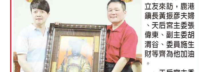
金曲歌王翁立友來訪，鹿港鎮長黃振彥夫婦、天后宮主委張偉東、副主委胡渭谷、委員施生財等齊為他加油。