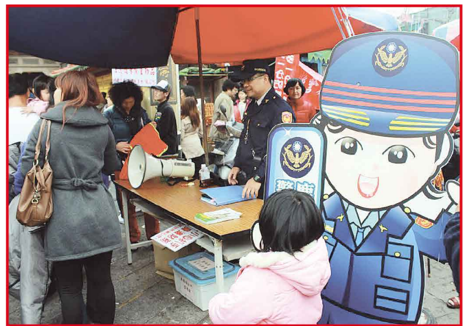
天后宮管委會分赴鹿港轄區各派出所致贈慰問金。

鹿港天后宮在春安工作開始的第一天就來關懷，也期勉鹿港警分局所有員警都能夠做好治安之外，也達到為民服務和交通順暢的目標，讓所有鄉親都能安心過個好年。 鹿港警分局於春節期間在天后宮廟口設立服務站，有效維護治安。