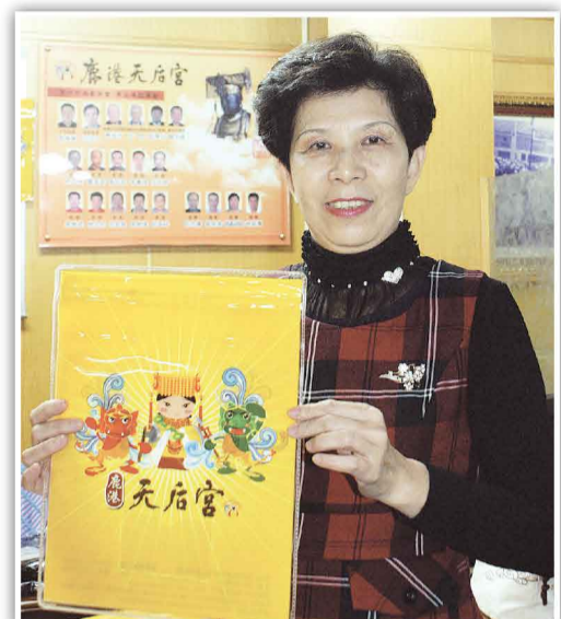
深受信眾好評的『媽祖儲金袋』，在坊間十分搶手。

鹿港天后宮電子信箱 e-mail: lugangmazu@yahoo.com.tw, 若有相關問題，歡迎撥打服務專線04-7779899，或傳真04-7779194。